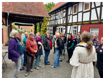
Hast Du Töne? 25.09.24 - Rhönhof LebensArt