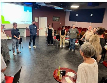
Hast Du Worte? 05.09.24 - Buchcafé

Das Projekt Kultur(K)Reise ist Teil des Förderprogramms „Aller.Land – zusammen gestalten. Strukturen stärken.“. Zurzeit erarbeiten bundesweit 97 Regionen ein Entwicklungskonzept, davon 8 Regionen in Hessen. Von einer Jury werden im 1. Halbjahr 2025 die 30 Siegerregionen ausgewählt, die eine 5 jährige Projektförderung erhalten werden. Das Programm wird gefördert durch die Beauftragte der Bundesregierung für Kultur und Medien (BKM), das Bundesministerium für Ernährung und Landwirtschaft (BMEL) sowie die Bundeszentrale für politische Bildung (bpb). Programmpartner ist das Bundesministerium des Innern und für Heimat (BMI). Aller.Land ist Teil des Bundesprogramms Ländliche Entwicklung und Regionale Wertschöpfung (BULE plus).