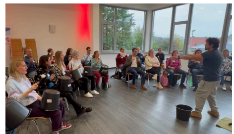
Bist Du kreativ? 08.10.24 - Haus der Generationen